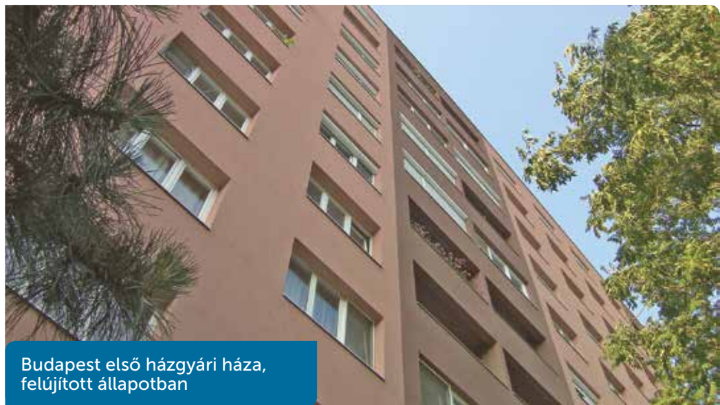
Budapest első házgyári háza, felújított állapotban

A szolgáltatásokért „cserébe” kisebbre méretezték a konyhát, hiszen itt már legfeljebb a közteremben vásárolt félkészételek elkészítésére, esetleg a vendéglőből hozott ételek felmelegítésére lett volna szükség – legalábbis az elképzelés szerint. Szintén csökkenthető a fürdőszoba mérete, hiszen nem kell azzal számolni, hogy egy mosógépnek, centrifugának helyet szorítsanak, ha a házak közé épített szolgáltatók kombinát ruhatisztítója elvégzi ezt a feladatot is.